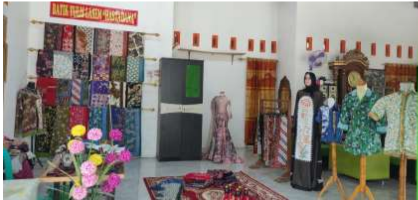
Gambar 2. Tempat Usaha

dalam menjalankan usaha batik. Mitra memahami posisi kelebihan dan kekurangan dalam pengelolaan usaha dan produk yang dihasilkan untuk menentukan penciptaan diversifikasi produk Batik Lasem, dalam bentuk desain motif batik maupun desain produk yang dihasilkan. Berikut disajikan gambaran mengenai tempat usaha Batik Hastadana.