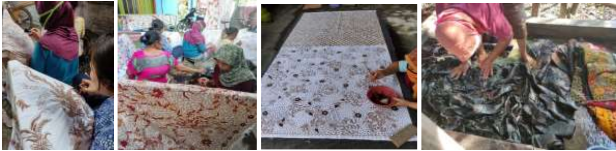
Gambar 3. Aktivitas Produksi Batik Lasem Dari kiri ke kanan: Nglengkreg, Nerusi, Nyoleti, Nglorot

kelanjutan proses pengaplikasian pada kain batik cap untuk menjadi produk yang memiliki nilai fungsi. Kegiatan produksi meliputi: pengecapan pada kain, pewarnaan dengan zat warna sintetis remasol, dan proses pelorodan. Peningkatan kualitas produksi akan berdampak pada daya saing dan penjualan atau keputusan pembelian oleh konsumen (Saraswati dkk., 2015). Berikut disajikan gambaran mengenai pelatihan proses produksi yang telah dilakukan.