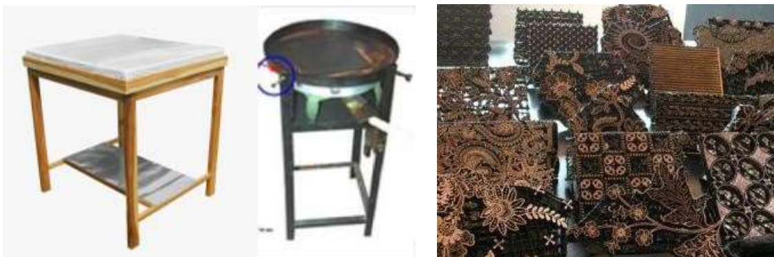
Gambar 5. Meja, Kompor, dan Alat Cap Batik dari Tembaga

Berikut alat yang digunakan dalam proses produksi membatik, diantaranya meja besar untuk membuat pola dan melakukan pengecapan, serta alat cap batik: