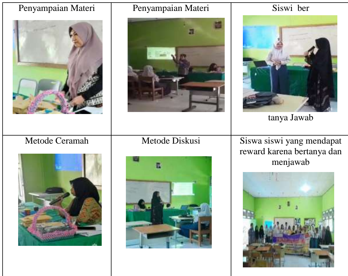
Gambar 1. Metode Pelaksanaan Pengabdian Masyarakat dengan Tanya jawab

Berikut ini adalah gambar-gambar metode pelaksanaan kegiatan Pengabdian Kepada Masyarakat