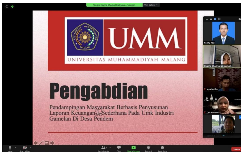
Gambar 1. Pembukaan Pelatihan oleh Tim Pengabdian

Kegiatan telah dilaksanakan secara daring melalui media zoom meeting dikarenakan pandemic covid-19. Pelaksanaan pelatihan pada hari senin, tanggal 10 Agustus 2020 dan diikuti oleh bapak ibu pelaku usaha UMK industri gamelan. Pelatihan penyusunan laporan keuangan sederhana dipandu oleh tim pengabdian, yaitu Bapak Kenny Roz dan Ibu Khusnul Rofida N. Dimulai dengan pembukaan dan arahan serta ramah tamah, pelatihan penyusunan laporan keuangan, dapat dilihat dari gambar 1 berikut ini: