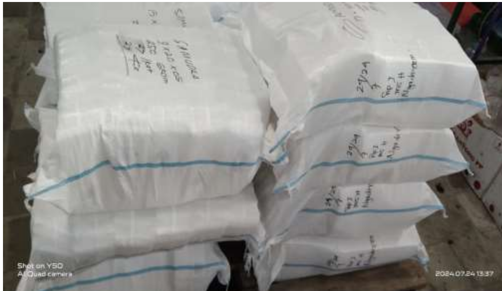
Gambar 5. Barang Jadi Setok Gudang