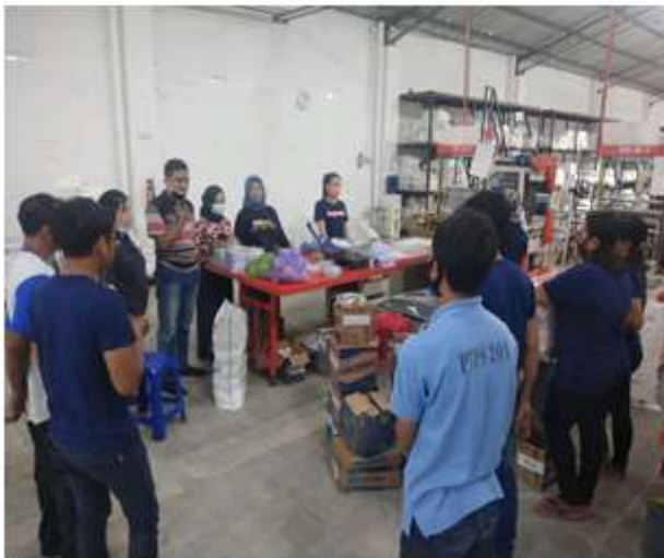
Gambar 1. Kegiatan Pemaparan Materi

Perencanaan produksi dilakukan dengan tujuan untuk dapat memproduksi barang-barang ( output ) dalam waktu tertentu di masa yang akan datang dengan kuantitas dan kualitas yang dikehendaki serta dengan keuntungan ( profit ) yang maksimum, dengan memperhatikan tiga golongan besar yang ada dalam masyarakat yaitu konsumen, buruh/pekerja, dan pengusaha (Lengkey., Kawet., & Palandeng, 2014); (Sari, 2018). Golongan konsumen menghendaki untuk mendapatkan barang-barang yang dibutuhkannya dalam jumlah yang cukup, dengan kualitas yang baik dan dengan harga yang dapat dijangkau atau mampu diayar oleh konsumen. Golongan buruh atau pekerja menghendaki agar perusahaan dapat mempertahankan terus kesempatan kerja yang mereka miliki, dan dapat mengembangkannya, serta adanya jaminan keselamatan kerja. Sedangkan golongan pengusaha menghendaki tingkat keuntungan ( profit ) tertentu, perusahaan dapat bekerja dengan kapasitas yang optimal, dan fasilitas produksi yang terdapat dalam perusahaan dapat digunakan sebaik-baiknya atau seefisien mungkin.