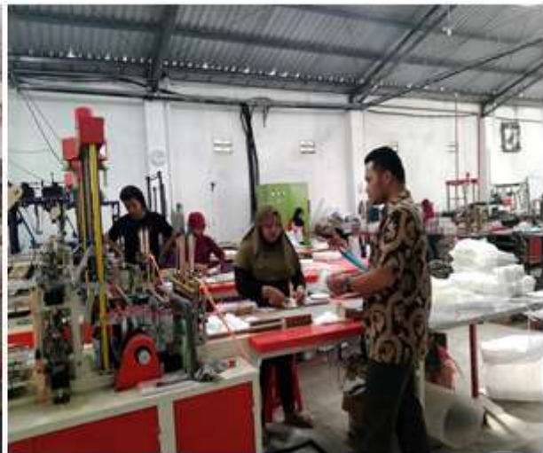
Gambar 2. Kegiatan Pegontrolan Hasil

Perencanaan produksi memerlukan pertimbangan dan ketelitian yang terinci dalam menganalisis kebijaksanaan, karena perencanaan ini merupakan dasar sebagai penentu bagi manajer dalam rangka mencapai tujuan perusahaan yang dipimpinnya, perencanaan produksi merupakan suatu fungsi yang menentukan batas-batas dari kegiatan perusahaan dimasa yang akan datang.