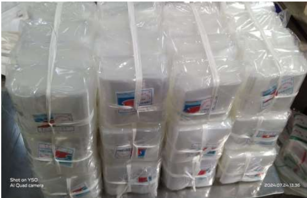
Gambar 4. Hasil Packing Plastik Kemasan

agar tercipta produk yang sesuai harapan konsumen, lingkungan kerja yang nyaman sampai meningkatkan taraf hidup yang lebih baik karena konsumen akan melakukan pemesanan yang rutin sehingga karyawan tetap bisa bekerja dan dapat penghasilan yang mencukupi.