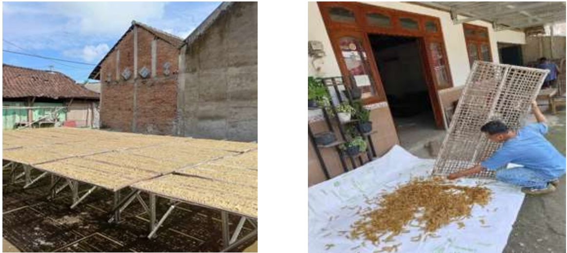
Gambar 4. Proses Pengeringan Rambak