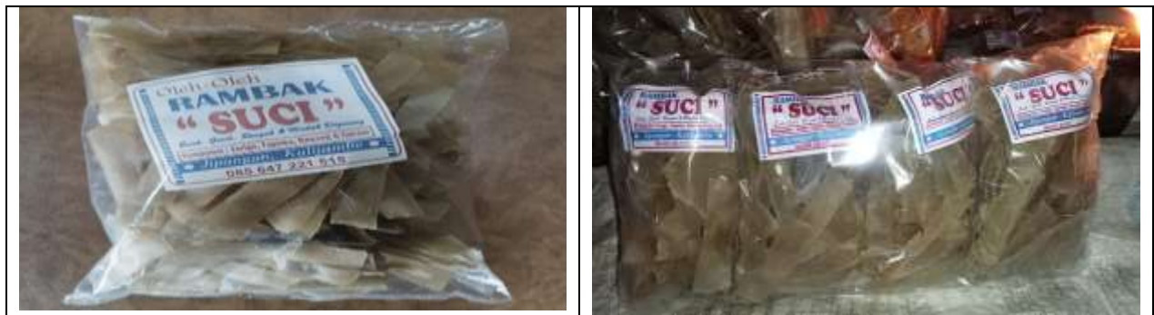
Gambar 5. Pengemasan Kerupuk

Kerupuk yang sudah kering di kemas dalam keadaan mentah kemudian diberi label etelah itu di tutup di press menggunakan lilin. Kerupuk dijual dalam metode offline dengan menitipkan kewarung terdekat. Hasil penjualan kerupuk dalam satu bulan juga meningkat. Hal itu dikarenakan tidak adanya kenaikan harga di saat bahan baku naik sehingga penjualan kerupuk tetap stabil akan tetapi adapenguran takaran di saat bahan baku sedang ada kenaikan . Hasil produksi kerupuk bawang dalam kegiatan ini dengan total 100 kemasan sekitar 30kg adonan