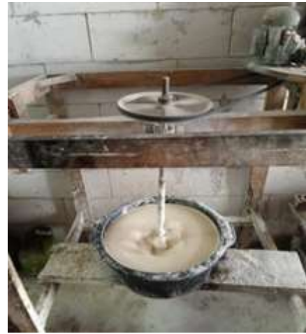
Gambar 2. Proses Pembuatan Rambak