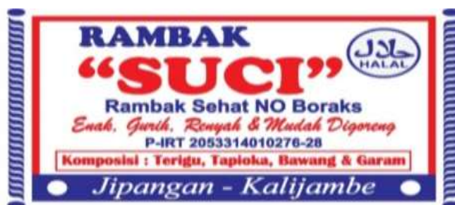
Gambar 5. Logo Rambak Suci

aspek pemasaran kami melakukan aktivitas pembuatan logo sederhana bagi UMKM Rambak Suci. Logo tersebut kemudian kami jadikan foto profil pada akun sosial media instagram.