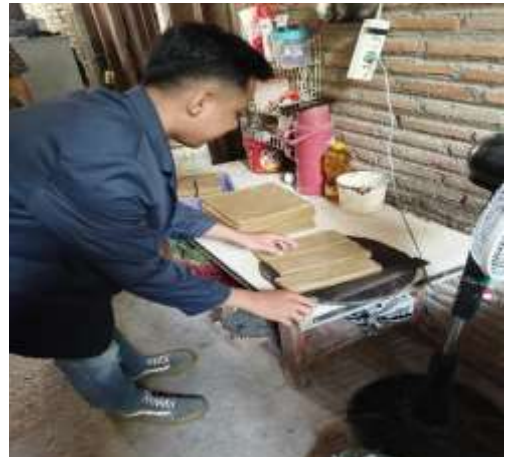
Gambar 3. Proses Penyimpanan dan Pematangan Rambak