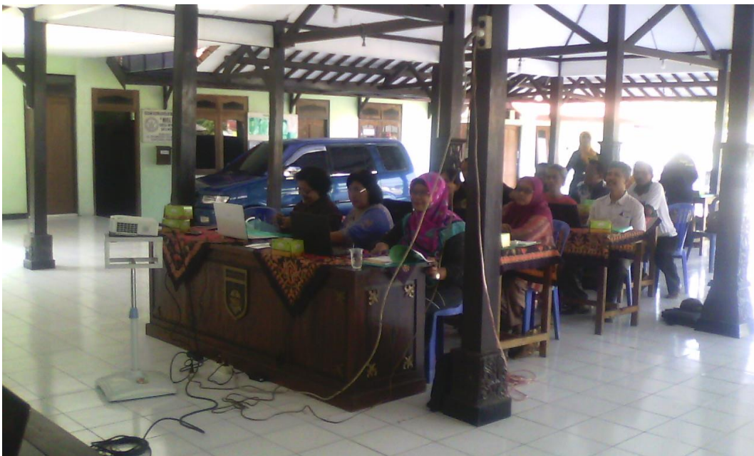
Foto pelaksanaan pengabdian kepada masyarakat