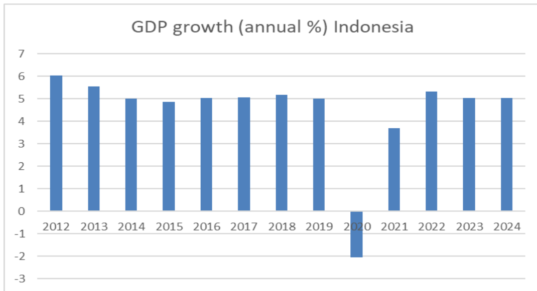
Gambar 1. Grafik Laju Pertumbuhan PDB Indonesia Tahun 2012-2024