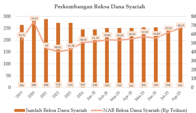
Gambar 2. Perkembangan Reksa Dana Syariah di Indonesia

Berdasarkan Gambar 1, NAB reksa dana syariah per Agustus 2025 tercatat sebesar Rp66.525,71 miliar, sedangkan NAB reksa dana konvensional mencapai Rp483.901,22 miliar. Meskipun terdapat perbedaan yang cukup besar, reksa dana syariah tetap menunjukkan kecenderungan pertumbuhan positif dalam beberapa tahun terakhir. Kesenjangan tersebut mengindikasikan bahwa preferensi investor masih lebih banyak tertuju pada instrumen konvensional dibandingkan dengan instrumen syariah.