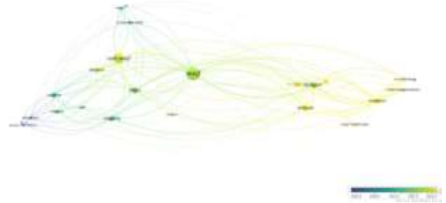
Gambar 3. Visualisasi overlay dari kata kunci

Analisis kata kunci menggunakan analisis bibliometrik, penulis menghasilkan peta konseptual yang menggambarkan keterkaitan antara kata kunci yang termasuk dalam pencarian basis data. Penggambaran overlay kata kunci, yang dikategorikan berdasarkan pencocokan warna, ditunjukkan pada Gambar 2.